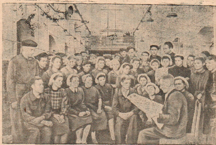
На предприятиях Ленинграда проходят читки материалов Пятой Сессии Верховного Совета СССР.

Заведующий отделом партийных, профсоюзных и комсомольских организаций райкома КПСС.