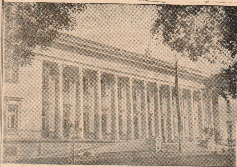
Народная Республика Болгария. В столице республики София развернулось большое жилищное строительство. В этом году здесь сооружается около 400 жилых и 57 общественных и административных зданий.

На снимке: новое здание государственной публичной библиотеки имени В. Коларова в Софии.