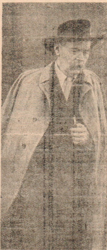
Алексей Максимович Горький (Снимок сделан в июне 1935 г.)