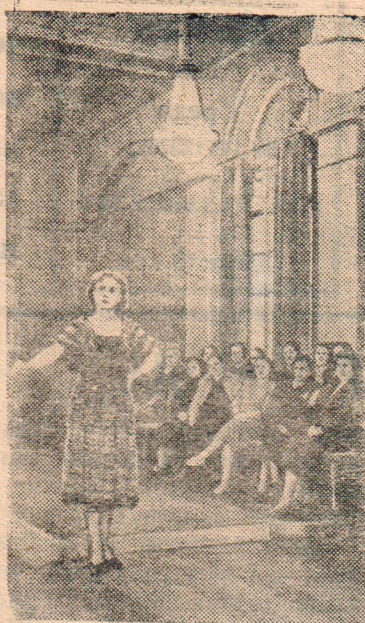
Ленинградский Дом моделей создает образцы одежды для швейных фабрик и ателье индивидуального пошива Ленинградской, Псковской, Вологодской, Новгородской, Великолукской, Калининской и Архангельской областей.

На снимке: просмотр новой модели летнего платья.