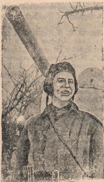
Герой обороны Сталинграда

ЖЕНЕВА, 3 февраля. Войска под Сталинградом. По приказу Гейделя с 4 по 6 февраля должны быть закрыты все увеселительные учреждения.