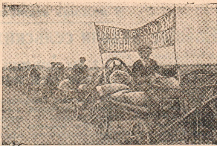
Красный обоз с хлебом нового урожая государству (колхоз „Победитель“, Горьковской области). (Фотохроника ТАСС).

В районе Кушевской происходили особенно ожесточенные бои. Один крупный населенный пункт в течение дня три раза переходил из рук в руки. Противник несет большие потери. Подбито 7 танков и уничтожено свыше 800 немецких солдат и офицеров.