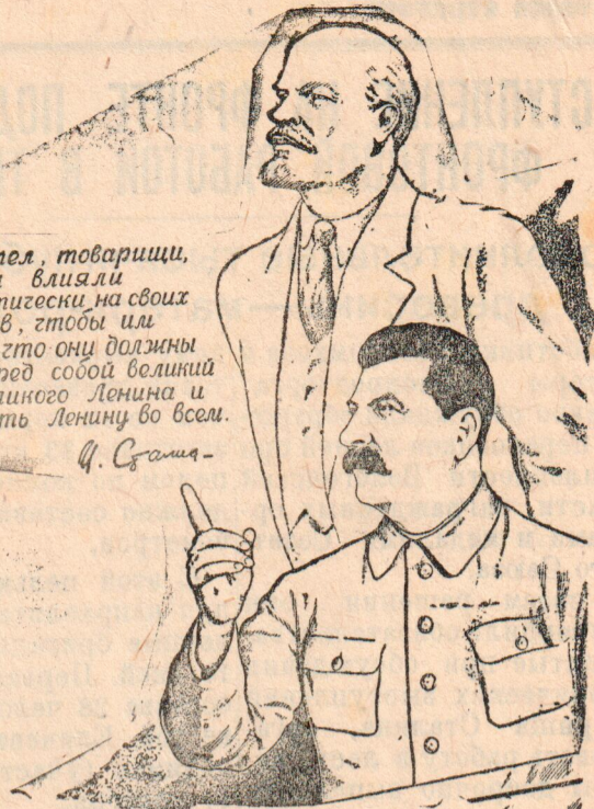
Пять лет назад — 11 декабря 1937 г. — товарищ Сталин выступил на предвыборном собрании Сталинского избирательного округа по выборам в Верховный Совет СССР.