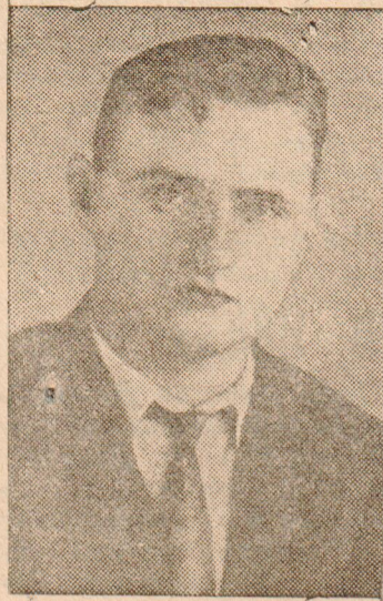
Капитан героического экипажа ледокола «Георгий Седов» Константин Сергеевич БАДИГИН—кандидат в депутаты Мурманского областного Совета.