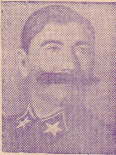
Маршал Советского Союза тов. С. М. Буденный

Социалистическое, соревнование вологодских и ленинградских лесозаготовителей призвано сыграть огромную роль в улучшении лесозаготовок. Пожелаем соревнующимся областям успеха в работе. („Лесная промышленность“).