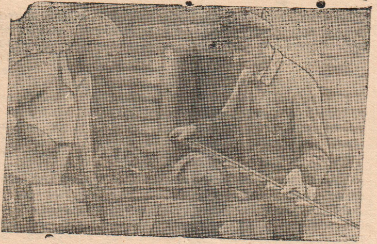
За подготовкой уборочного инвентаря.

Общее районное собрание председателей колхозов и сельских советов призывает всех колхозников еще шире развернуть социалистическое соревнование между колхозами, бригадами и колхозниками, тем самым ширить и множить ряды стахановцев, повести решительную борьбу с рвачами и лодырями колхозного производства, решительно пресекая всякие попытки и проявления направленные на расхищение и разбазаривание общественных колхозных земель.