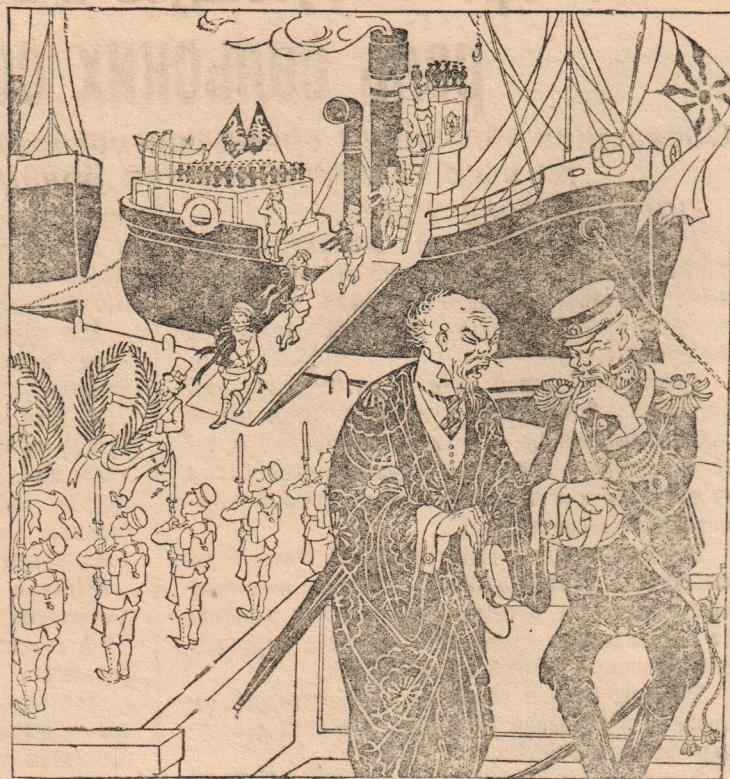
— Поехали за углем, а возим пепел... Рисунок К. ТЕОДОРОВИЧА.

Японская армия сжигает тела убитых солдат и офицеров и отправляет пепел в урнах на родину.