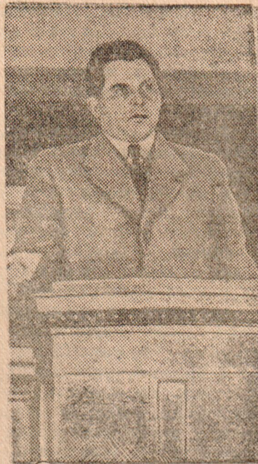
Народный Комиссар Финансов Союза ССР тов. А. Г. Зверев.

Гигантски усилилась финансовая мощь Советского Союза. СССР располагает огромными внутренними ресурсами, вполне достаточными для того, чтобы в третьей пятилетке обеспечить еще более грандиозную программу народно-хозяйственного,