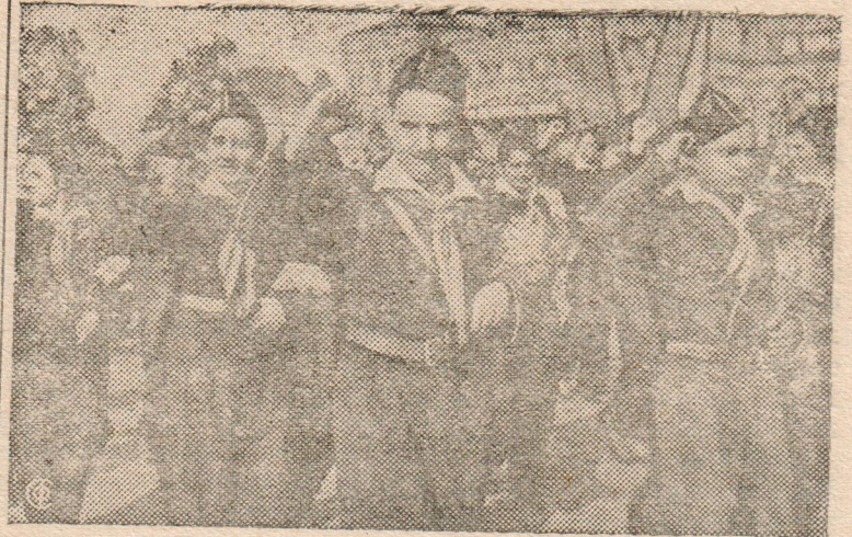
12 сентября в Москве на Красной площади состоялась мощная демонстрация, посвященная празднованию XXIII Международного Юношеского Дня.

Юные представители революционного испанского народа на Красной площади.