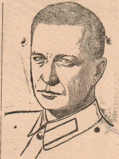
Герой Советского Союза тов. ГРОМОВ М. М.