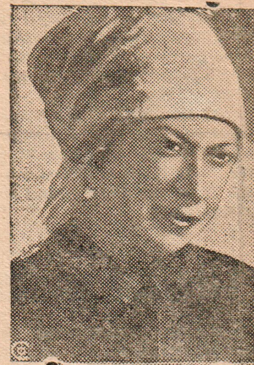
Н. К. КРУПСКАЯ в одежде крестьянки (1917 г.)