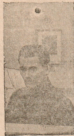
Н. И. ЕЖОВ

С восторгом встретили сообщение о награждении тов. Ежова рабочие московского Электрокомбината. «Партия и правительство — говорит в резолюции рабочих — достойно оценили твои заслуги в беспощадной борьбе за очищение нашей страны от агентуры фашизма — троцкистов, бухаринцев, этих злейших врагов народа и всего трудового человечества. Мы будем учиться у тебя, тов. Ежов, большевистской, сталинской бдительности и поможем тебе в дальнейшей борьбе за окончательное выкорчевывание всех врагов народа». (ТАСС).