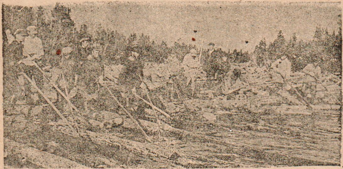
Молевой сплав на Еденье. Разбивают залом