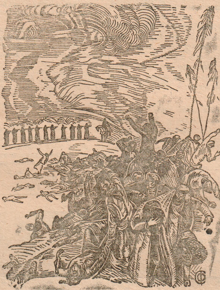
Гравюра худ. СТАРОНОСОВА

25 лет тому назад, 17 апреля 1912 года, на далекой сибирской реке Лене, около Бодайбо, по приказу жандармского офицера Трещенко, были зверски расстреляны безоружные рабочие золотых приисков. Эти прииски были настоящим золотым дном для русских и иностранных капиталистов, которые зверской эксплуатацией выжимали из рабочих огромные прибыли. Вот что пишется в одном документе о жилищных условиях рабочих: «Зимой в них так холодно, что мокрые сапоги примерзают к полу, рабочие вынуждены спать в шапках, ввиду того, что наголовья приходится у промерзающих стен». Эти бараки—дряхлые, гнилые, сырые и промерзлые, рабочие называли «багашиками» и «конюшнями», так как одна их половина была занята людьми, а другая—лошадьми. В стенах были дыры, заткнутые тряпками, стекла позеленели от сырости, рамы вываливались, все покосилось и рушилось. Рабочие голодные и с семьями спали вповалку на грязном полу и нарах. Насекомые кишели в кустах грязного белья и заражали людей. Тут же стирали, варили пищу, развешивали пеленки, сушили одежду. Пьяная администрация насиловала жен рабочих, их дочерей, даже несовершеннолетних девочек, избивала рабочих, выгоняла их за малейшее подозрение в недовольстве, арестовывала, обшаривала, обирала до нитки.