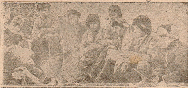
НА ЛЕСОРАЗРАБОТКАХ За чтением газеты во время отдыха

Осовская начальная школа, Усть-Печенгского сельсовета.