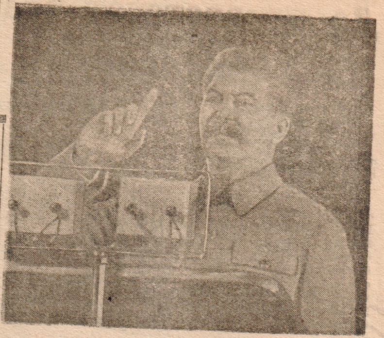
Выступление товарища И. В. СТАЛИНА на предвыборном собрании избирателей Сталинского избирательного округа г. Москвы 11 декабря 1937 г. в Большом театре

Торез подчеркивает, что каждый французский коммунист должен овладеть учением Ленина—Сталина и должен распространять это учение. Советский Союз, заявил он, живой пример осуществления социализма. Ленин—Сталин сделали социалистическую мечту вчерашнего дня сегодняшней реальностью. „Съезд коммунистической партии, — заканчивает свой доклад Торез, — позволит сделать новый шаг вперед к коммунизму, к лучшему будущему, к счастью“ (ТАСС).