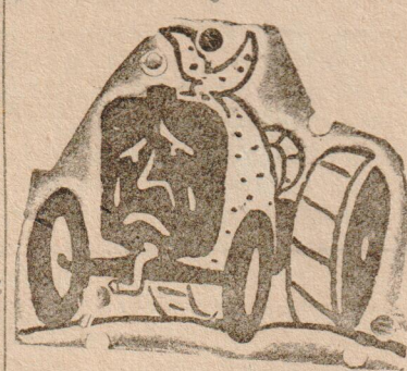
Так, примерно, выглядят тракторы после выхода из ремонта на Тафта и Михайловке

Одно время Лопатин оставался за начальника лесопункта. Перед ним неоднократно ставили вопрос об улучшении бытовых условий для лесорубов, но на законные требования Лопатин от