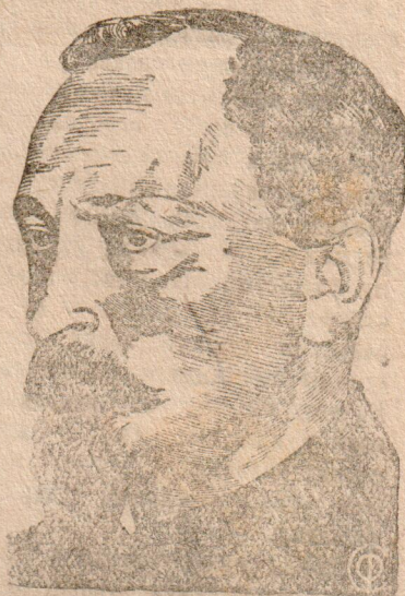
Ф. Э. ДЗЕРЖИНСКИЙ первый председатель ВЧК

ВЧК разбила гнусные планы германской разведки и уничтожила контрреволюционную организацию «Правый центр», с которой тогдашнее германское посольство