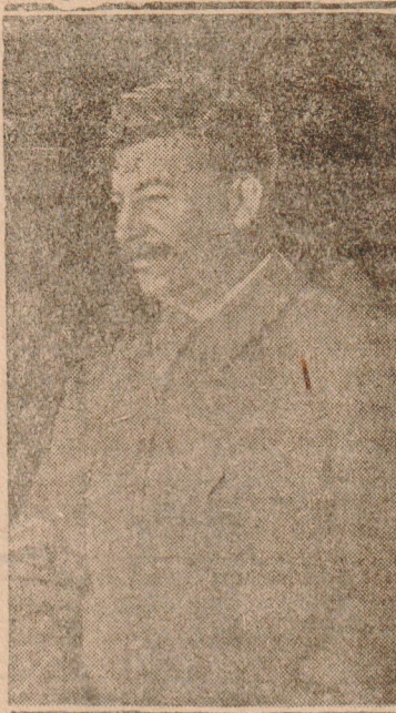
Иосиф Виссарионович СТАЛИН первый депутат Верховного Совета СССР

Да здравствует первый депутат народа—наш любимый тов. Сталин!