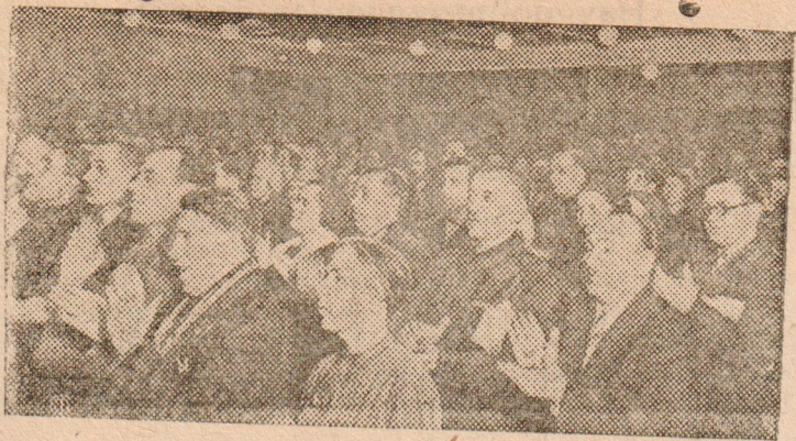
На предвыборном окружном совещании Сталинского избирательного округа (Москва). Участники совещания—представители трудящихся Сталинского избирательного округа единодушно приветствуют выдвижение товарища Сталина кандидатом в депутаты Совета Союза.