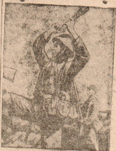
Китайский солдат с гранатой (Шанхайский фронт)

Участковая избирательная комиссия по выборам в Верховный Совет СССР по избирательному участку № 147, охватывающему избирателей, проживающих в населенных пунктах: Савино, Видрино, Воробьево, Притыкино, Чиботова, Внуково, Скребеихово, Задняя, Ирослаиха, Зелени, детская