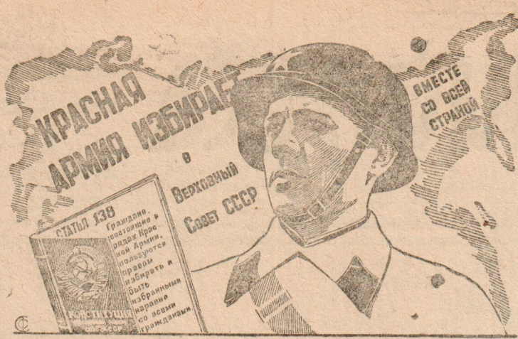
Плакат художника Н. Долгорукова выпускаемый ИЗОГИЗ'ом к выборам в Верховный Совет СССР

письме комиссия, напоминая о дне выборов в Верховный Совет СССР, рассказывает, где будут производиться выборы, где и когда можно получить справки и консультации по вопросам выборов. Одновременно комиссия напоминает о необходимости проверить правильность занесения избирателей в списки.