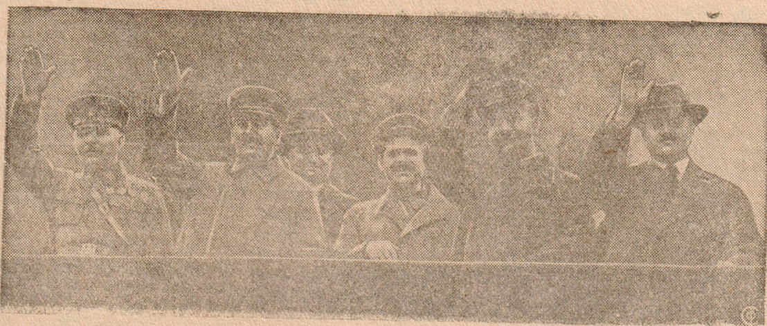
Руководители партии и правительства (слева направо): т. т. ВОРОШИЛОВ, СТАЛИН, ДИМИТОВ, АНДРЕЕВ, КАГАНОВИЧ, МОЛОТОВ на трибуне мавзолея Ленина 1 мая 1937 года