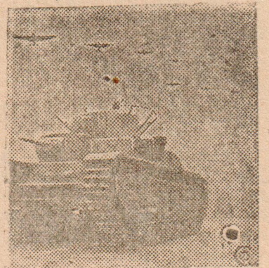
На Красной площади

Злые карикатуры пригвождены к позорному столбу пытающихся взорвать мир фашистов и их презренных лакеев — троц-