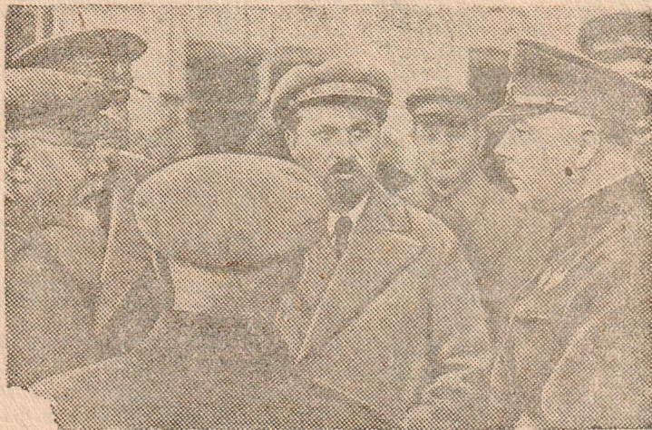
Нарком обороны маршал Советского Союза тов. К. Е. ВОРОШИЛОВ на маневрах войск Киевского военного округа в 1935 г. Тов. ВОРОШИЛОВ на Киевском вокзале; крайний слева—председатель ЦИК СССР и ВУЦИК тов. Г. И. ПЕТРОВСКИЙ, в центре—председатель Совнаркома СССР тов. ЛЮБЧЕНКО

Вы отлично помните прошлое. Наша молодежь это прошлое изучает, пионеры в особенности, комсомольцы в том числе, изучают это прошлое