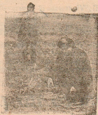
Инспектор по качеству осматривает всходы