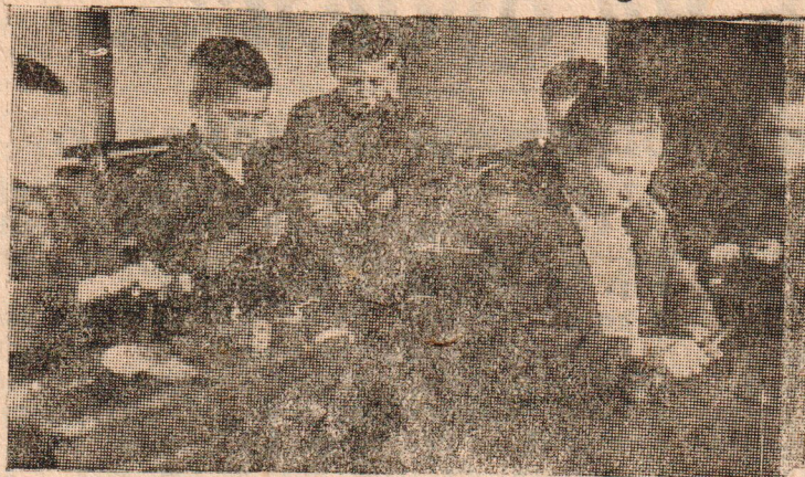
Кружок юных конструкторов—моделистов при Маныловской начальной школе

Председателям облисполкомов и крайисполкомов, а также секретарям обкомов и край