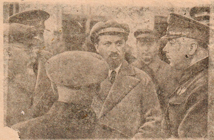
Нарком обороны СССР тов. К. Е. ВОРОШИЛОВ на Киевском вокзале. Крайний слева—председатель ЦИК СССР и ВУЦИК тов. Г. И. ПЕТРОВСКИЙ, в центре—председатель Совнаркома УССР тов. ЛЮБЧЕНКО.