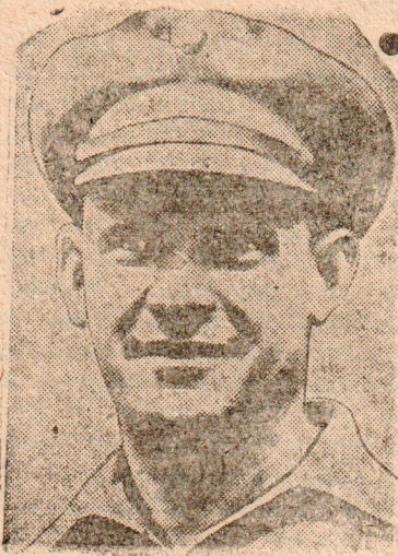
Тов. Эрнст ТЕЛЬМАН, почетный председатель VII конгресса Коминтерна

Докладом тов. Димитрова, —восклицает т. Мануильский под бурные аплодисменты всего зала,—конгресс особенно ярко подчеркнул свою волю в борьбе за единую рабочую партию в каждой отдельной стране и во всем мире.