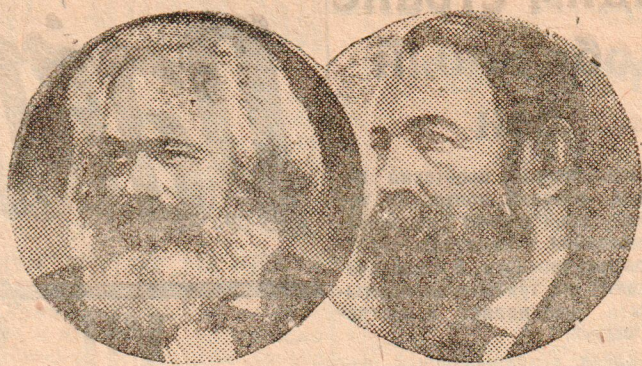
Основатели научного коммунизма: Карл МАРКС и Фридрих ЭНГЕЛЬС (к 40 летию со дня смерти Фридриха ЭНГЕЛЬСА)

Резолюция VII всемирного конгресса Коммунистического Интернационала по отчетному докладу Интернациональной Контрольной Комиссии VII Всемирный конгресс Коммунистического Интернационала: а) одобряет работу Интернациональной Контрольной Комиссии; б) утверждает кассовый отчет за время от VI до VII всемирного конгресса Коммунистического Интернационала.