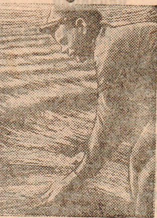
Расстил льна на лугах

Ненастная погода заставляет изыскивать все способы изготовления кормов на зиму. Это должны учесть руководители всех, а особенно отстающих, колхозов. Г. Белоусов.