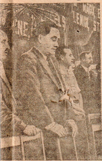
ДИМИТРОВ, ФЕРДИ и МАРТИ на VII Конгрессе Коминтерна

Вместо того, чтобы мобилизовать все силы народа против фашизма, они преследуют коммунистов».