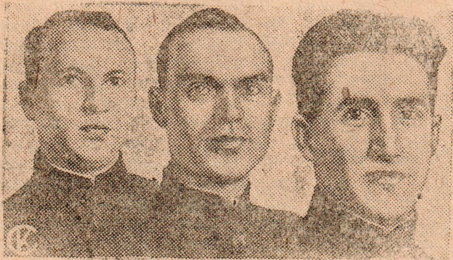
НА СНИМКАХ: участники перелета — герой Советского союза тов. ЛЕВАНЕВСКИЙ (в центре), слева — летчик т. БАЙДУКОВ, справа — штурман т. ЛЕВЧЕНКО; карта перелета