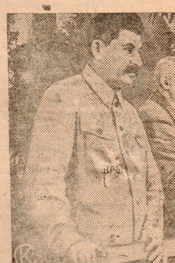
Тот. тов. СТАЛИН, ПЯТНИЦКИЙ в президиуме VII Всемирн

Но министры-социал-демократы в Чехословакии, Дании, Швеции, Норвегии не ведут настоящей борьбы против фашизма. Чешский народ охвачен тревогой за судьбы своей национальной независимости. Ком