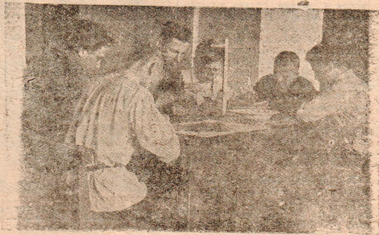
Проверка всхожести семян