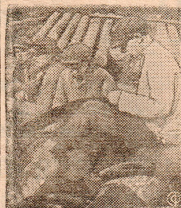
Во время «загоги» на окорке