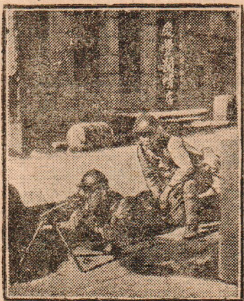
Японские пулеметчики в боевой позиции на улицах Мукдена.

стычек с китайскими отрядами. Китайский отряд, появившийся вблизи станции Чан-Чун, подвергся бомбардировке со стороны японского самолета. В Тоананьский уезд (в западной части Манчжурии) под предлогом якобы вспыхнувшей там чумы отправлена японская медицинская экспедиция под охраной военных самолетов (очевидно: медицинская экспедиция понадобилась только для того, чтобы чем-нибудь „оправдать“ посылку самолетов).