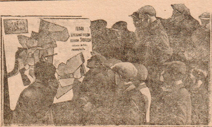
Комсомольцы на занятиях по полит-учебе.