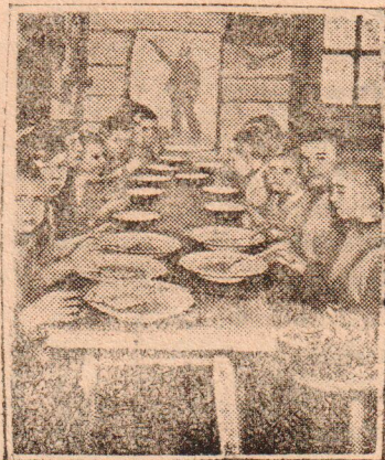
НА СНИМКЕ: Дети колхозников за обедом в детском садике.