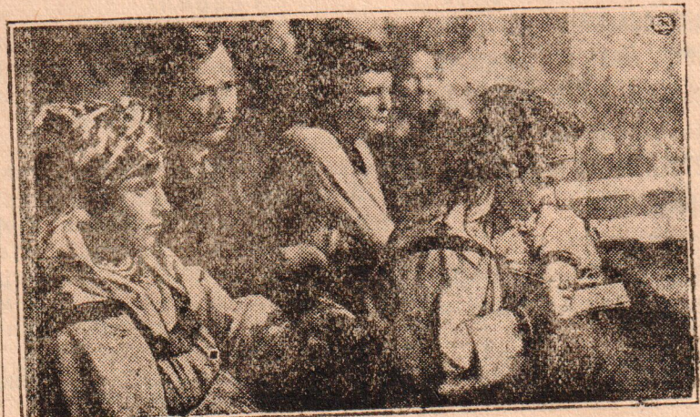
НА VI СЪЕЗДЕ СОВЕТОВ СОЮЗА ССР