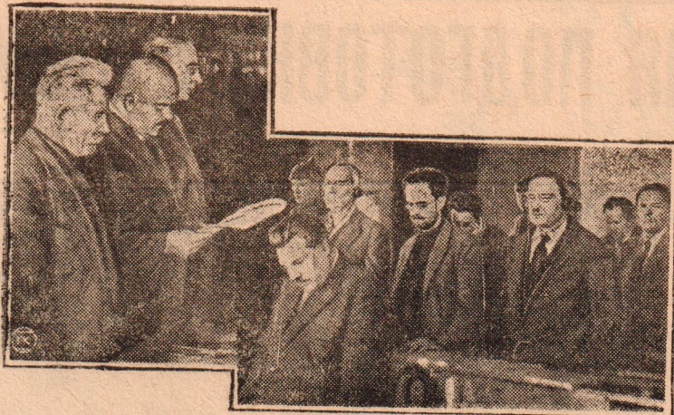
ПРОЛЕТАРСКИЙ СУД ВЫНЕС ПРИГОВОР КОНТР-РЕВО- ЛЮЦИОННОЙ ОРГАНИЗАЦИИ МЕНШЕВИНОВ.