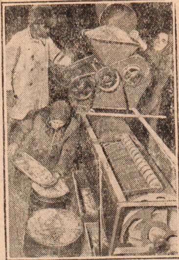
На снимке: Готовятся ко второму большевистской весне. Очистка семян триером.

В департаменте Лауры (Париж) 70 проц. фиктивных станков не работает. В маленьком индустриальном городе Вуарон (Франция), насчитывающем всего 14 тысяч жителей, зарегистрировано 1500 безработных.