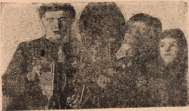
Кино-передвижка «Союзкино» в баране Комсомольского лесопункта.