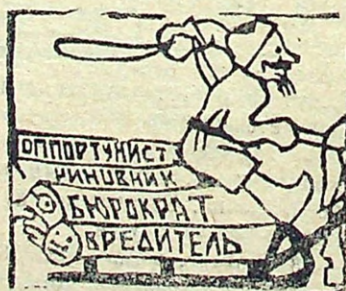
Негодных на аппарата на сваанку.

к аппарату, наказывая разгильдяев и вредителей, такие же требования мы предъявляем к каждому рубщику и возчику. РАБЧИЕ ДОЛЖНЫ ПОНЯТЬ, ЧТО У ЛЕСА В РАЗВИТИИ СЕЛЬСКОГО ХОЗЯЙСТВА, УКРЕПЛЕНИЕ КОЛХОЗОВ И Т.Д. В СЕРЬЕЗНОЙ СТЕПЕНИ ЗАВИСИТ ОТ УСПЕХОВ ЛЕСОЗАГОТОВОК. Основная масса бедноты, колхоз-