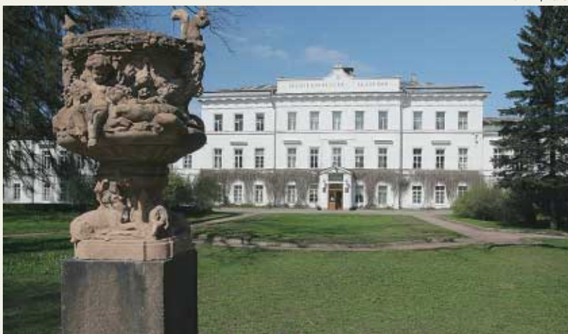
Санкт-Петербургский лесной институт (ныне Санкт-Петербургский государственный лесотехнический университет им. С. М. Кирова)