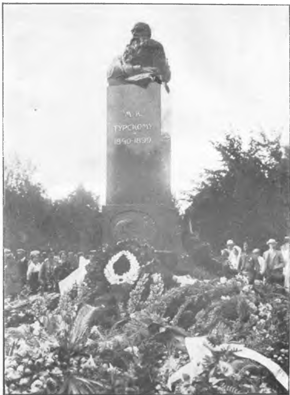
Памятникъ профессору лѣсоводства М. К. Турскому.