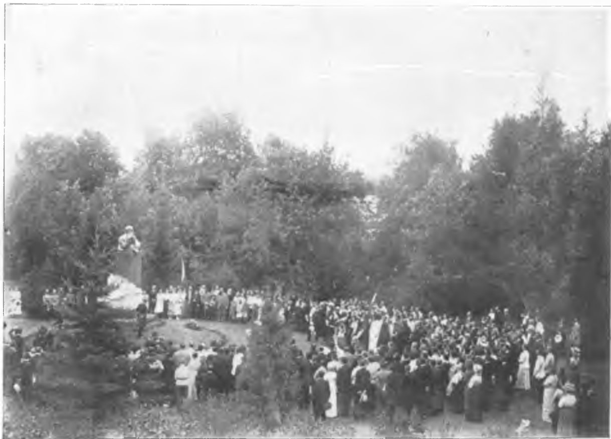
Съ памятника спадаетъ пелена, закрывавшая его.