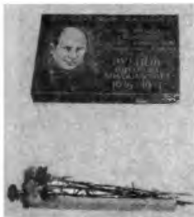
Памятная доска на здании Хибинского технического колледжа, где учился Н. Рубцов