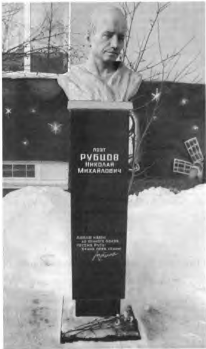
Бюст Н. Рубцову у здания Мурманской областной детско-юношеской библиотеки