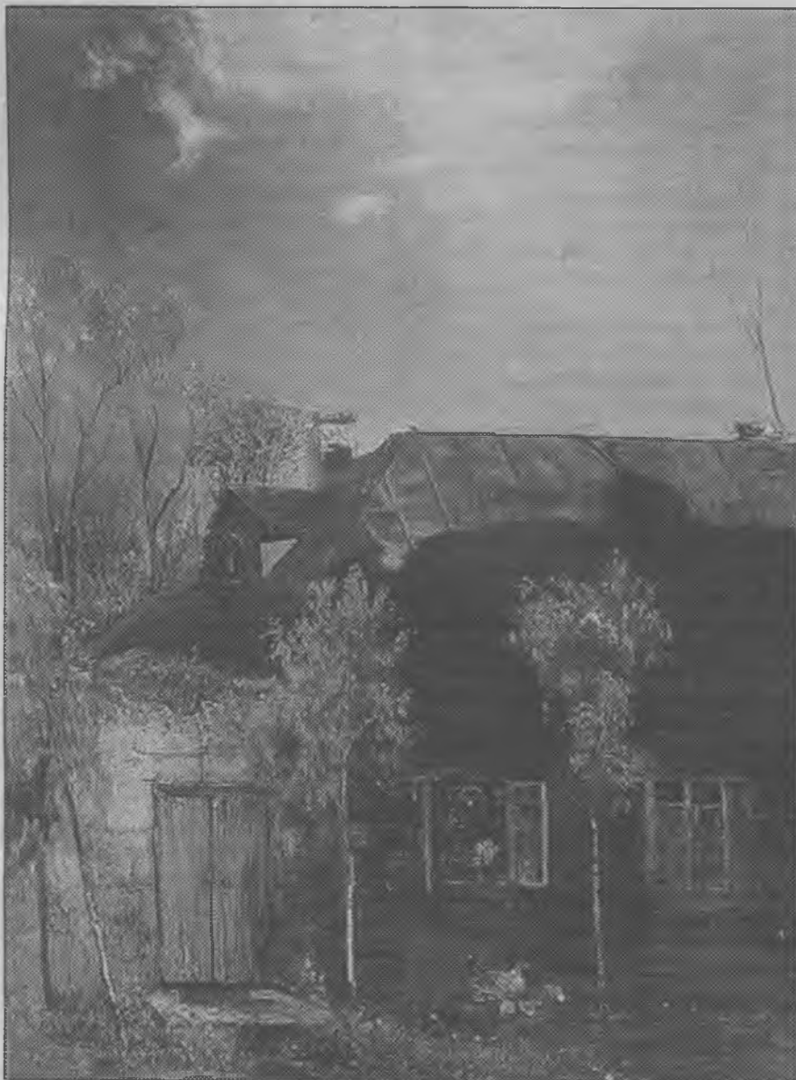
Домик в провинции. Весна. Художник А.К. Саврасов

ствительной, ранимой. Трудно судить, каким бы он стал, если бы рос в семье, окружённый заботой и лаской, как все дети.