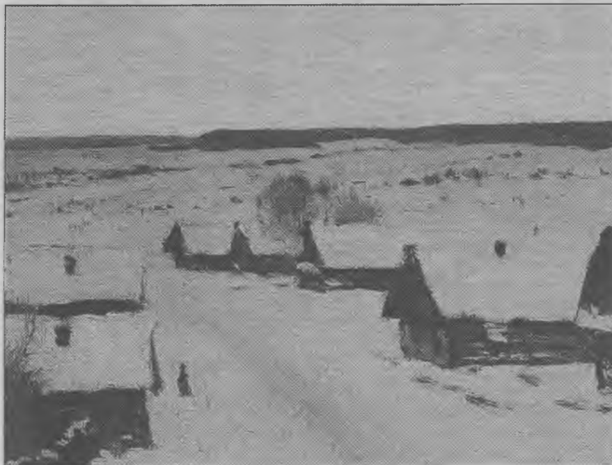
Деревня. Зима. Художник И.И. Левитан. 1877—1878 гг.