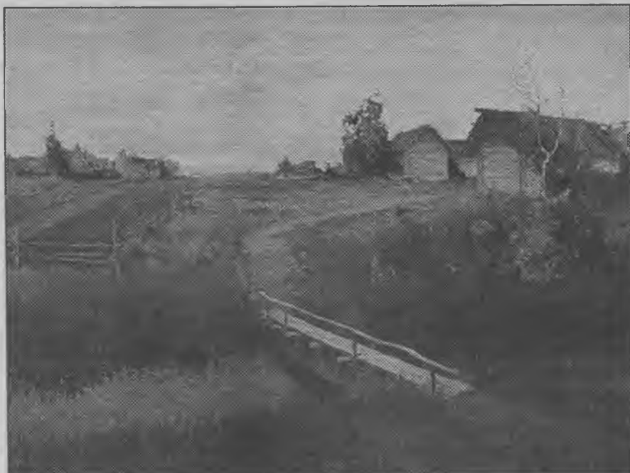
Село. Закат. Художник А.Н. Шильдер. 1919 г.

ВЕДУЩИЙ (2): Судьба, кажется, сделала всё возможное, чтобы убить природное дарование этого человека. Сиротство, голод, холод, тоска по родительской ласке, по дому, которого у него так и не было до самой безвременной смерти, тяжёлая работа наравне со взрослыми. В таких условиях душа человека глохнет, черствеет или, совсем наоборот, становится чув-