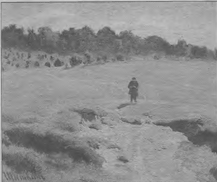
Мальчик в поле. Художник И.И. Шишкин

Меж болотных стволов красовался восток огнеликий... Вот наступит октябрь — и покажутся вдруг журавли! И разбудят меня, позовут журавлиные клики Над моим чердаком, над болотом, забытым вдали... Широко по Руси предназначенный срок увяданья Возвещают они, как сказание древних страниц. Всё, что есть на душе, до конца выражает рыдание И высокий полёт этих гордых прославленных птиц. Широко на Руси машут птицам согласные руки. И забытость болот, и утраты знобящих полей —