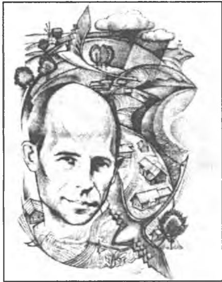
Гравюра из сборника стихов Н. Рубцова «Последний пароход»