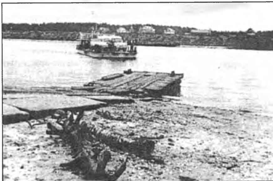
Перевоз на реке Сухоне близ Тотмы

На войне отца убила пуля. а у нас в деревне у оград —