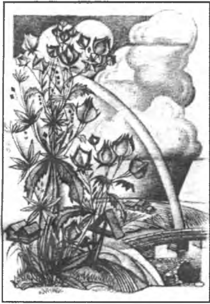
Гравюра из сборника стихов Н. Рубцова «Последний пароход»