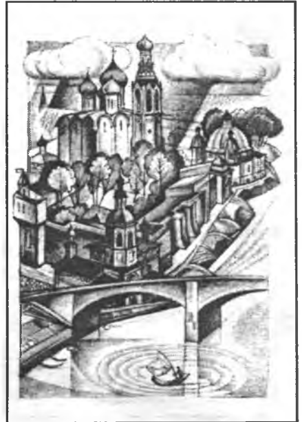
Гравюра из сборника стихов Н. Рубцова «Последний пароход»

Школа моя деревянная!.. Время придет уезжать — Речка за мною туманная Будет бежать и бежать.