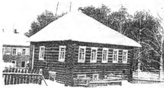
Дом родителей Н. Рубцова, перевезенный из д. Самылково в с. Биряково

Николай Рубцов — поэт долгожданный. Блок и Есенин были пос-