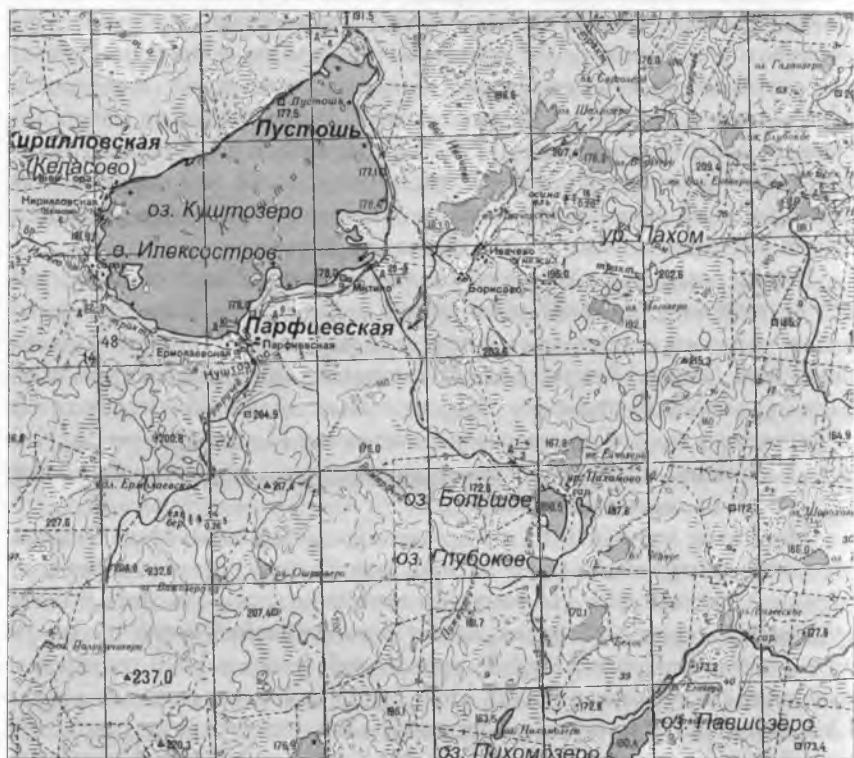
Географические объекты Куштозерья: топонимические маркеры очерка. Сост. Е.А. Скупинова

От времен земства на все Ундозеро с населением в 1500 душ осталось одно здание только начальной школы. Теперь Ундозерский Погост стал школьным городком. Большое здание постройки 1935 года, четыре кулацких дома, перевезенных из Куштозера и приспособленных для школьных целей, хорошо спланированы на площадке, усаженной деревьями, и составляют прекрасное впечатление о заботах к населению Советской власти. Следовало бы подтянуть сюда и другие культурные учреждения, и сам сельсовет. Это взаимно усилило бы работу всех учреждений, и бывший поповский церковный центр стал бы действительно культурным советским центром в интересах всего населения.