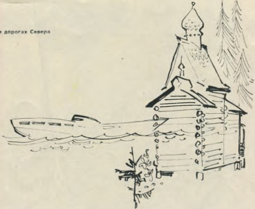
На дорогах Севера

Я запечатлел в рисунках некоторые архитектурные памятники русского северного края, характерные приметы нашего времени, а также людей, живущих в этом изумительном уголке советской земли.