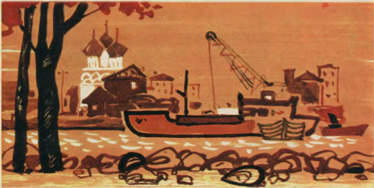
Белозерск. В порту.