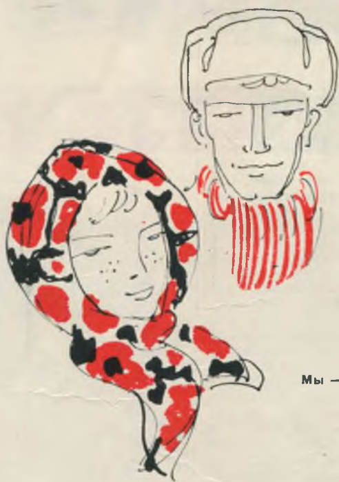
Мы — вологодские.