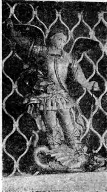
Рѣзная статуя Георгия Побѣдоносца въ Георгіевской ц. въ Тотмѣ.

Шуйское... Два храма... и цѣлый рядъ домовъ, по обимъ берегамъ Сухоны.