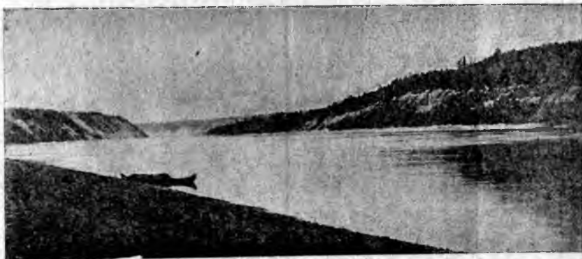
Рѣка Сухона передъ Верхней Тотмой.

Начались пожары... Городъ нѣсколько разъ погорѣлъ.