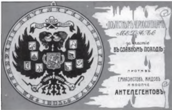
Изображение этой медали говорит о том, что, по мнению художника, власти поддерживали антиинтеллигентские и погромные настроения

многих открыток революционного содержания. На одной из таких открыток на кроваво-красном фоне изображена медаль, по периметру которой надпись: «За усмирение антелегентского бунта. 1905 г.». На самой медали - черный двуглавый орел: одна голова с надписью «Трепов», другая - «Витте». Вместо лап - руки с нагайкой и штыком и подписью «Игна-тьев». Вместо сердца - медальон «Победоносцев». На крыльях - восемь маленьких медальонов с изображением ножа, виселиц, кандалов и т.д. На правом поле карточки - текст: «Доблестнымъ черносотенцамъ медаль за участие в славномъ походѣ противъ емназистовъ, жидовъ и воопче антелегентовъ». Никаких данных, по которым можно было бы судить об авторе и его партийной принадлежности, на карточке не обнаруживается.