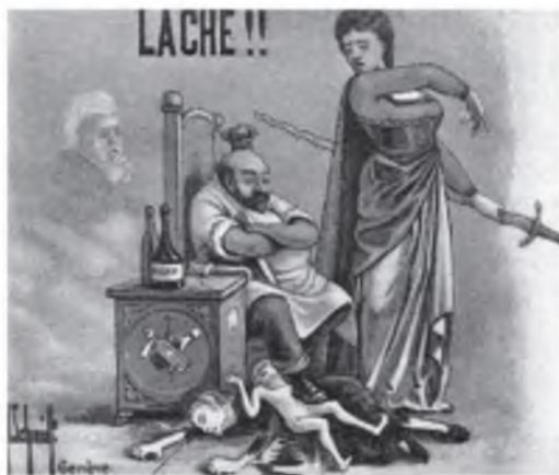
Эта антицарская открытка пришла в Россию из Швейцарии

Известно, что и европейские социал-демократы тоже выпускали открытки революционного содержания. Они попадали в Россию, как правило, нелегальными путями. Но большинство таких посылок попадало в руки таможенникам. На одной из открыток из моей коллекции изображена карикатурная фигура царя, сидя-