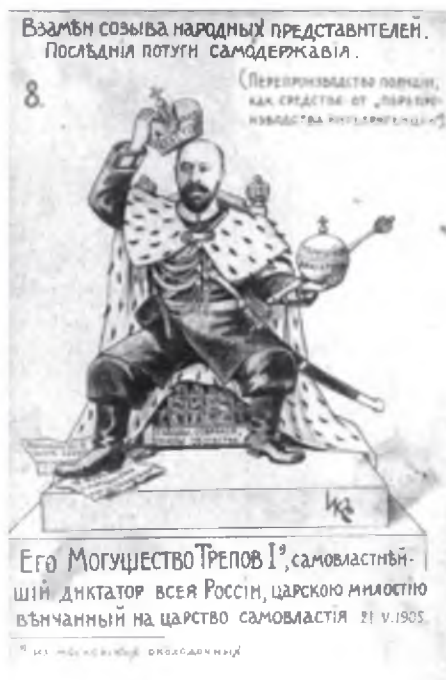
Еще одна открытка М. Чемоданова, направленная против генерала Трепова, в 1905 году бывшего временным генерал-губернатором Санкт-Петербурга

Еще раньше появились размножавшиеся фотоспособом открытки-прокламации. Полиция в обеих столицах вынуждена была мобилизовать дворников и приказать им всех таких разносчиков частных писем ловить и доставлять в участки. Так в руки полиции попали открытки, на которых имелись инициалы художников: «Икс», «И. Грек», «Червь», «Эмче», «М. Лилин». Художник с такими псевдонимами давно состоял на учете в полиции. Это был известный москов-