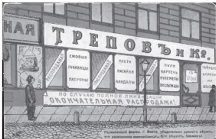
Очередная открытка против Трепова и представляемой им власти