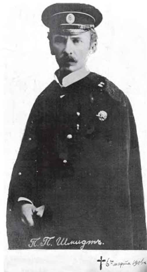
Открытка с портретом лейтенанта П.П. Шмидта, внизу - дата его гибели

Я вспомнил об этой истории потому, что в беседе со мной известный писатель-пушкинист Виктор Гроссман, живший в ту пору в Одессе, рассказывал об открытках в защиту осужденного «барабанщика революции». Они распространились эсера-