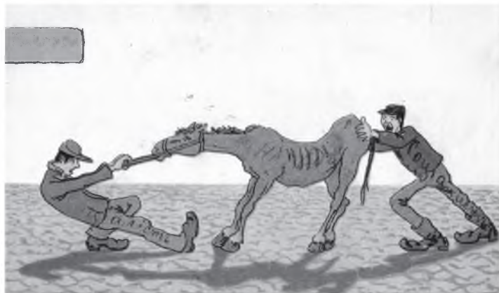
Эта открытка-прокламация показывает социалистов, втягивающих народ в «распублику»

Вероятно, потому именно в Вологде удалось найти довольно много открыток революционного содержания. Но нужно понимать и то, что в тяжкие тридцать седьмые годы хранить в семейных архивах подобные документы было смертельно опасно. Потому