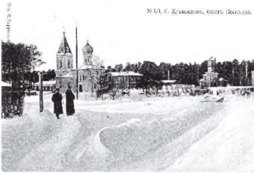
Открытка с видом поселка Кувшиново выпущена вологодским издательством Тарутиной

еще и поэма Богданова «Марсианин, заброшенный на Землю», изданная в 1924 году.