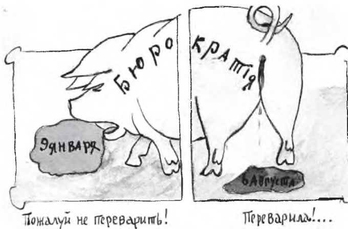
Одна из самых острых сатирических открыток В. Каррика

В 2008 году Государственный центральный музей современной истории России провел выставку «Портреты депутатов Государственной думы Российской империи 1906-1917 годов». Карточ-