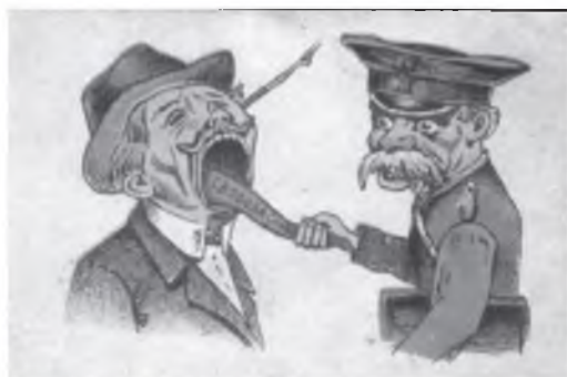
Так неизвестный художник изобразил цензуру, препятствующую гласности

Той же теме была посвящена выполненная в цвете открытка, на которой чиновник крепко держит за язык писателя или журналиста. Имя автора этого рисунка, как и многих других открыток, до сих пор не установлено.