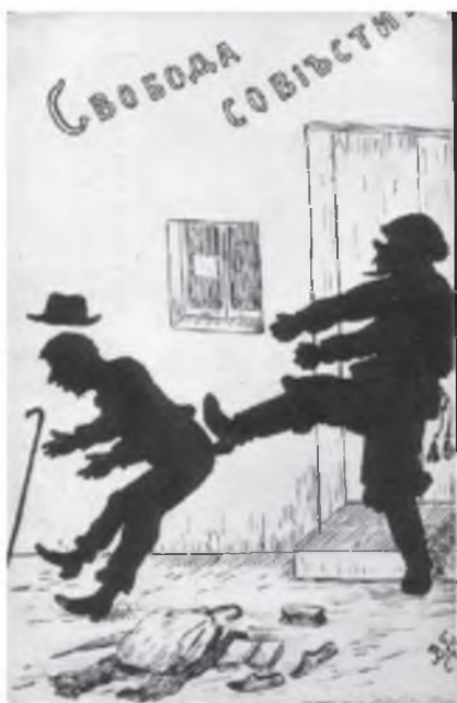
Открытка, подписанная «В. Гулак», посвящена борьбе за свободу

Киев и Одесса на революционные события откликнулись изданием целой серии открыток, выполненных в технике модной в начале XX века силуэтной графики художниками, скрывавшимися под псевдонимом «В. Гулак» и «Н.М.».