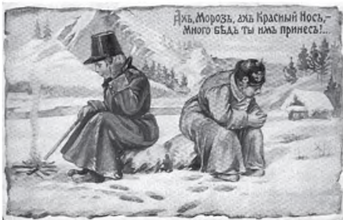
Одна из сатирических открыток, посвященных зимней кампании 1914 года

Настоящей находкой для меня стали последние две карточки, когда я увидел на их обороте штамп: «Военно-санитарный поезд № 1012». Именно этот