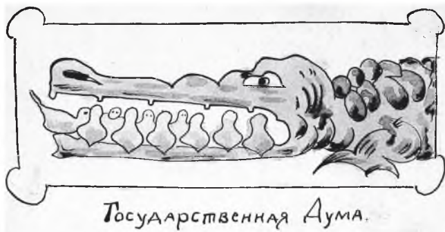
Зеленый крокодил на открытке В. Каррика символизировал жандармерию.

Так откликнулся В. Каррик на широко обсуждавшуюся просьбу полицейских наградить участников подавления «противозаконных действий»