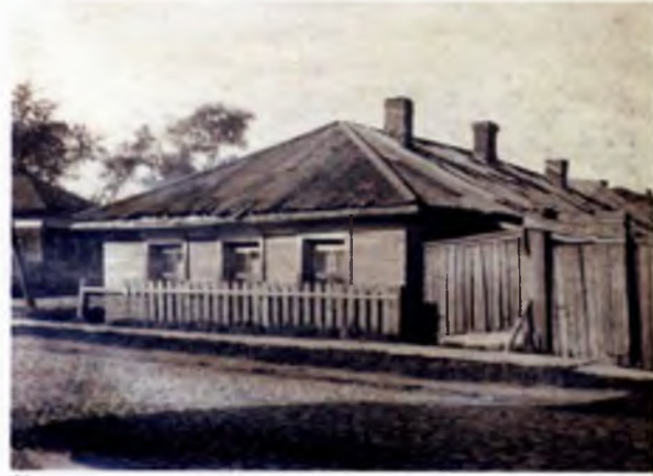
Один из старых жилых домов Вологды. Фотография из альбома «Строительство и благоустройство г. Вологды в 1934–1938 годах» (Государственный архив Вологодской области)

Обо всех (или, точнее, почти обо всех) сюжетах, которые были обозначены выше, речь пойдет и в настоящем издании. Задача авторского коллектива состояла в том, чтобы проследить судьбы города как исторического феномена с момента его рождения и до сегодняшнего дня на примере «богородицовой» Вологды — города на Русском Севере. Наше предисловие имело целью, с одной стороны, создать своего рода исторический фон, на котором будут освещены события в самой Вологде и вокруг нее; с другой — показать значение города во всемирно-историческом процессе. Понятно, что древняя, с нашей точки зрения, Вологда появилась гораздо позже многих всемирно известных городов. Гораздо старше ее античные города, например, столица современной Греции — Афины или столицы Италии — Рим. То же самое можно сказать о столице Франции — Париже (галло-римской Лютеции) или Англии — Лондоне (основанном римлянами Лондинии), истоки которых также восходят к Античности.