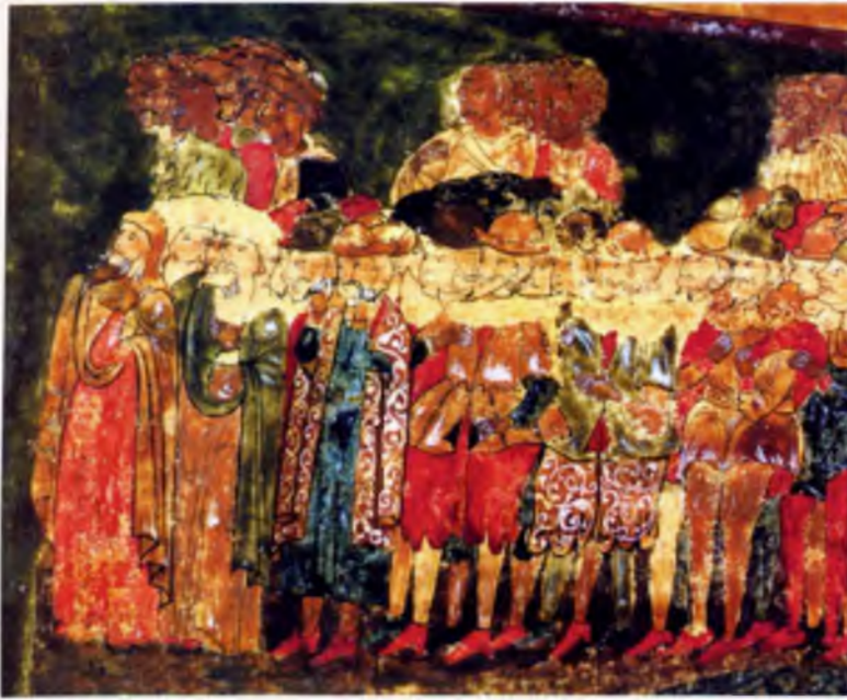
Грешники, идущие в ад. Фрагмент иконы «Страшный суд» из Мироносицкой церкви в Вологде. Вторая половина XVII века.