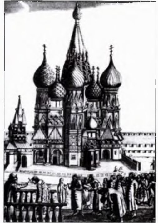
Молебен у Покровского собора и Лобного места на Красной площади в Москве. Фрагмент гравюры из книги «Описание путешествия А. Олсена». 1656 год