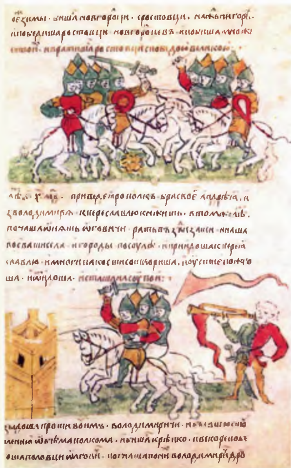
Страница из лицевого летописного свода, рассказывающая о столкновениях в 1130-х годах войск Новгорода и великого князя из-за права собирать дань на Севере, в том числе и в вологодских землях

Определенно старше Вологды и возникшие в Средние века многие знаменитые города Западной Европы (Брюгге, Гент, Аугсбург и др.) и многие древнерусские, такие, как Киев, Чернигов, Псков, Великий Новгород, и даже некоторые города нашей области — Белоозерск (если считать его преемником Белоозера) и Великий Устюг. Самим названием книги авторы хотели показать, что вся прошедшая история Вологды укладывается в рамки минувшего тысячелетия. В быденном сознании и даже на официальном уровне укоренились представления о Вологде как ровеснице столицы России Москвы, датой основания которой считается 1147 год. Эти представления, с научной точки зрения, вряд ли являются бесспорной истиной: первое заслуживающее доверия упоминание Вологды в исторических документах относится лишь к 1264 году. Быть может, резоннее назвать Вологду ровесницей столицы Германии Берлина, основанного в 1237 году? В любом случае Вологда находится в том почтенном возрасте, который достоин уважения. Читатель найдет пищу для размышлений на этот счет в книге и сам вынесет вердикт (хотя бы для самого себя) по этому спорному вопросу.