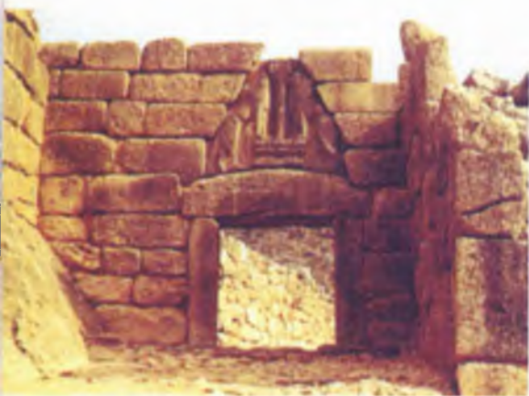
Львиные ворота в Микенах (Греция). Возведены в середине II тысячелетия до нашей эры