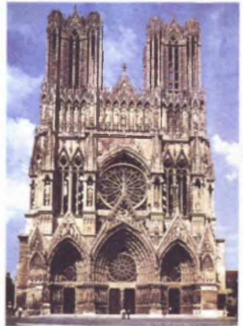
Готический собор в городе Реймсе (Франция). XIII—XV века