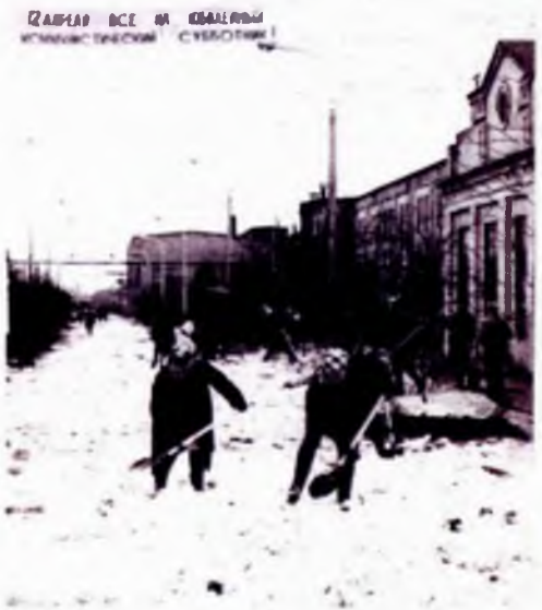
Юбилейный коммунистический субботник на территории завода «Северный коммунар» в честь 50-летия первого субботника, состоявшегося в Москве 12 апреля 1919 года