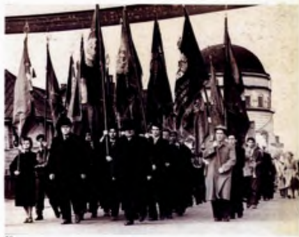
Колонна Вологодского государственного педагогического института на Первомайской демонстрации 1961 года. Перекресток улиц Клары Цеткин (ныне Благовещенская) и Батюшкова