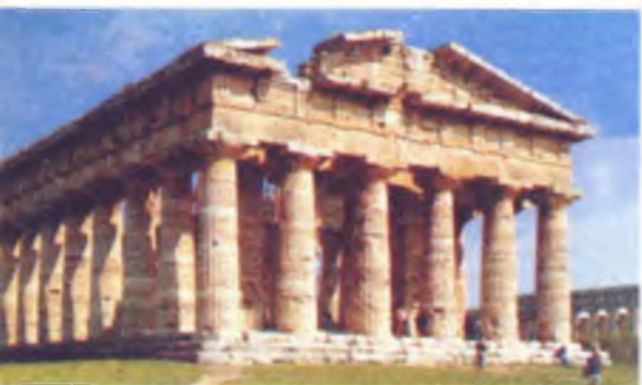
Храм богини Геры (II) в Посейдонии (ныне город Пестум в Южной Италии). V век до нашей эры