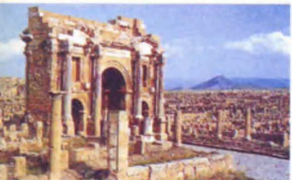
Триумфальная арка III века нашей эры в городе Тимгад (Алжир)

Вологда, истории которой посвящено настоящее издание, — город не самый древний и не самый большой. Это — город средних масштабов. Основной определяющий признак Вологды как исторического явления — ее принадлежность к тому типу поселений, которые называются городами. Поэтому попытаемся заглянуть вглубь веков и проследить основные этапы исторического развития городов. Такой экскурс в прошлое позволит читателю осознать, какое место в истории, особенно в истории России, занимает Вологда и в чем состоит ее самобытность, так ярко себя проявившая в различных сферах материальной и духовной культуры.