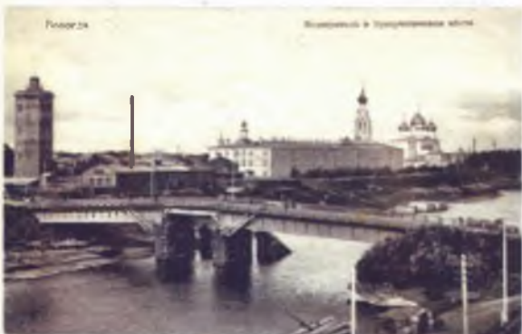
26 Водопровод и присутственные места. Открытка 1904–1908 годов. Вологда: Издательство И. Соколова и Л. Раевского