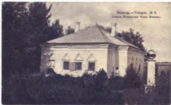
24 Вологда. Домик императора Петра Великого. Открытка 1914 года. Москва: Издательство контрагентства А. С. Суворина и К°