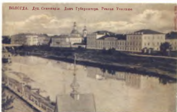
25 Духовная семинария. Дом губернатора. Реальное училище. Открытка 1909–1914 годов. Вологда: Издательство Е. Тарутиной