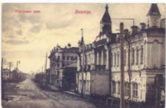
27 Городская дума. Открытка 1909–1917 годов

происходят небывалые, глобальные изменения. Внутренние причины, их породившие, обозначены выше. Меняется и внешний облик города, который все более приобретает черты искусственной среды обитания человека. Города навсегда прощаются с крепостными стенами, а причудливые переплетения тесных, кривых улочек сменяет регулярная, геометрически выверенная застройка. Возводятся кварталы новых многоэтажных зданий, а в окнах домов загораются сначала газовые, а затем электрические лампы. Улицы и проспекты «оснащаются» многоцветьем рекламы, суетой потока пешеходов, омнибусов, трамваев, первых автомобилей. «Ускоряется» течение времени, а вместе с ним — и жизнь горожанина. Европейский город эпохи Нового и Новейшего времени живет свежими биржевыми сводками, газетными перепалками, парламентскими баталиями, сплетнями о жизни знаменитостей и прочей внешней «атрибутикой», свойственной гражданскому обществу. Сомнительные украшения из фабричных труб на заводских окраинах становятся также важной составляющей нового городского пейзажа. Они же являются грозным напоминанием о том, что небывалый технический прогресс может обернуться против его творцов.