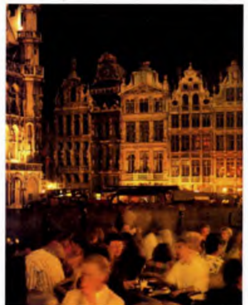
Площадь Гран-Плас в Брюсселе (Бельгия), застроенная в стиле барокко в конце XVII века

К началу Нового времени влияние городов на общество становится доминирующим. Преобладающими чертами города теперь являются унификация и интеграция. В эпоху развития общества индустриального типа в Западной Европе и Северной Америке