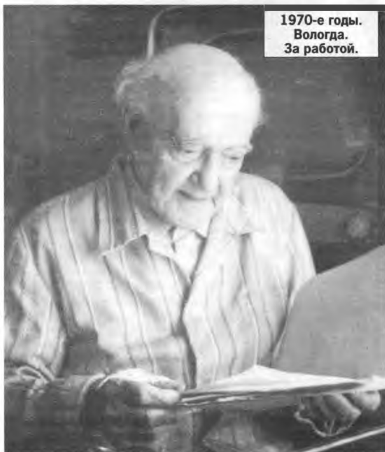
1970-е годы. Вологда. За работой.