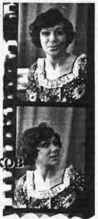
Пьехой мы потом долго переписывались.

В конце 80-х осуществил свою давнюю идею - открыл в ателье выставку эротического фото. Через три дня выходит в «Красном Севере» заметка о