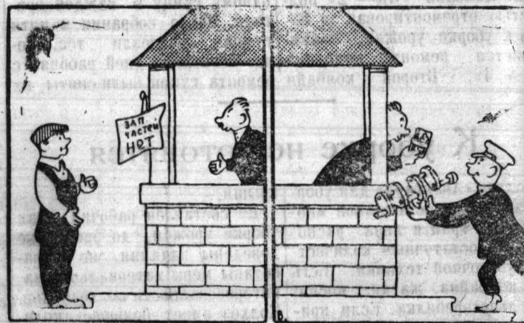
С одной стороны нет! Рис. М. Вайсборда.