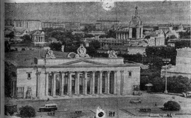
Москва. Общий вид Выставки достижений народного хозяйства СССР.

явил, что Индия сможет пойти по пути прогресса и разрешить проблему нищеты и безработицы только путем проведения в широких масштабах индустриализации.