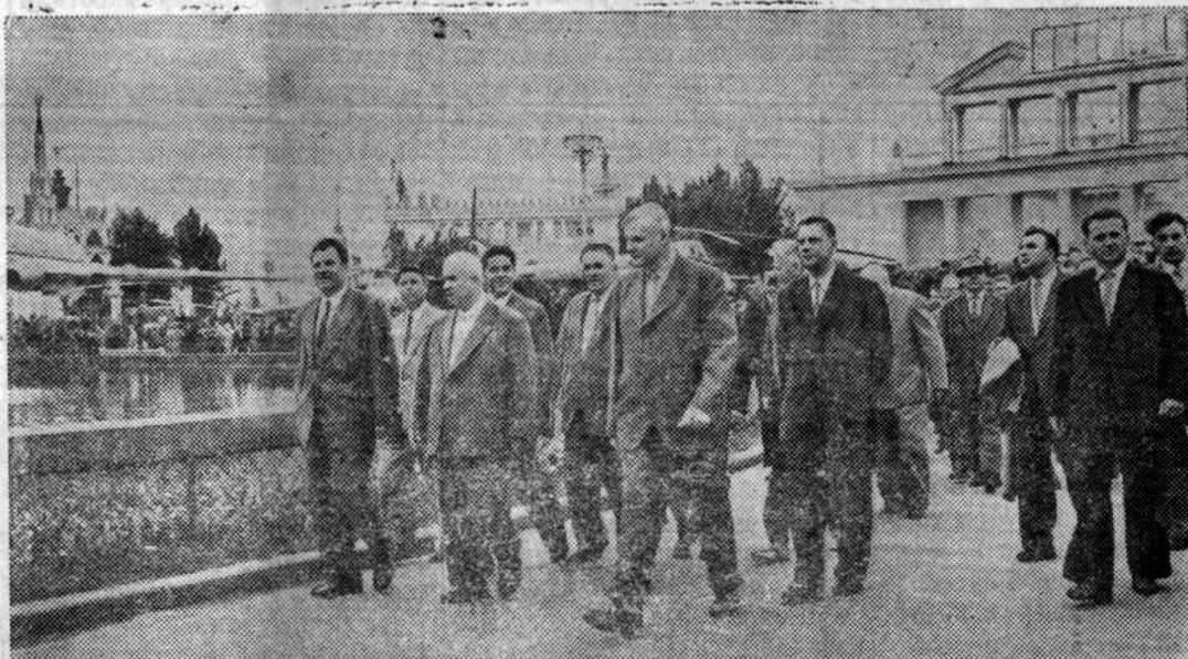
Москва. Руководители Коммунистической партии и Советского правительства во главе с Первым секретарем ЦК КПСС. Председателем Совета Министров СССР Н. С. Хрущевым осматривают Выставку достижений народного хозяйства СССР.